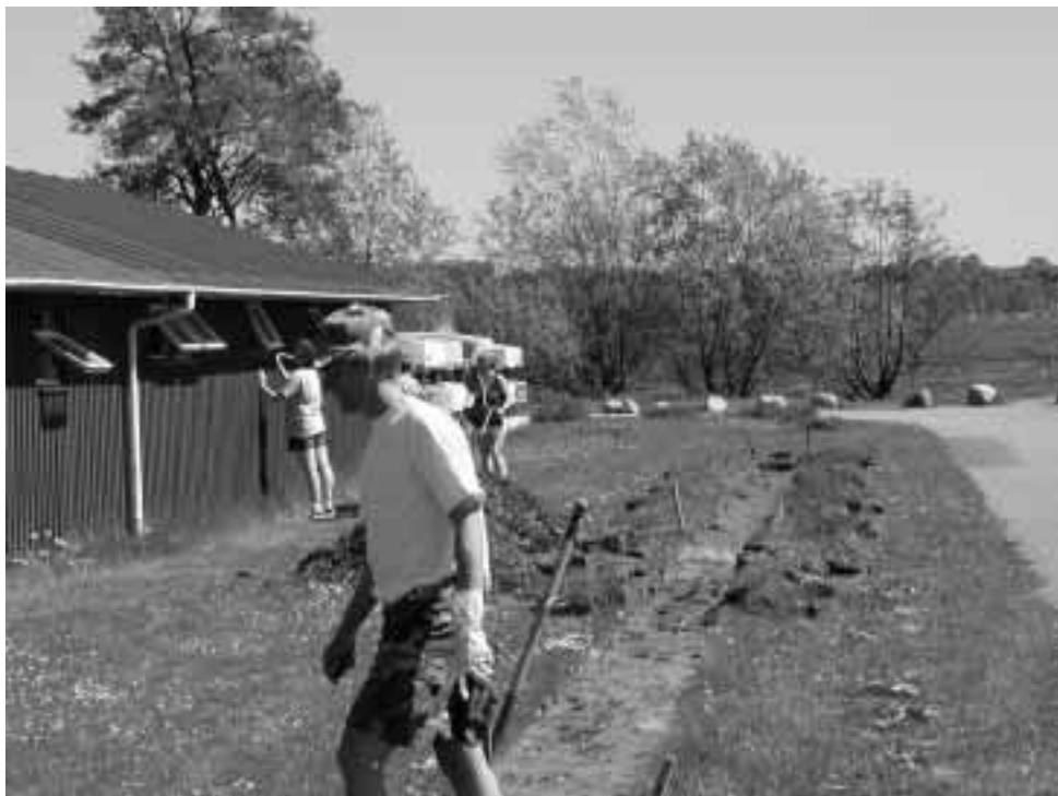
Arbejdsdag i og omkring klubhuset