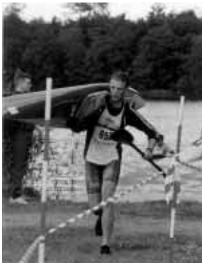
Heine i fuld fart...