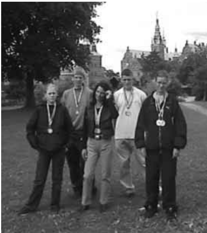
Nogle af medaljevinderne ved kortbane-kredsmesterskaberne

Fik du ikke en e-mail om dette blad og har du en e-mail adresse, så send den til wsj@wsj.dk