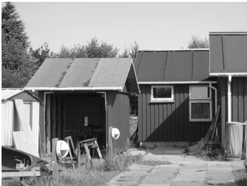
Saunatilbygningen & polohuset er ved at tage form