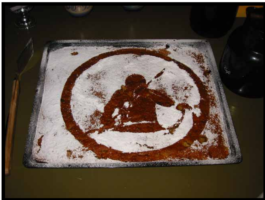
Malene K's flotte jubilæumskage - serveret til standerhejsningsfesten.