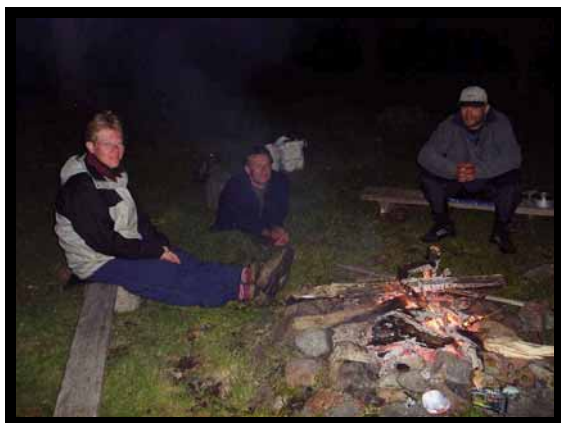
Råhygge på Arpö.

Næste blad udkommer aug/sep 2004. Deadline for indlæg er 15. august 2004.