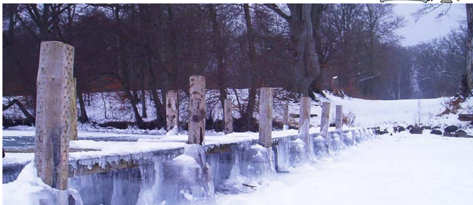
Vinteren var også hård sidste år.